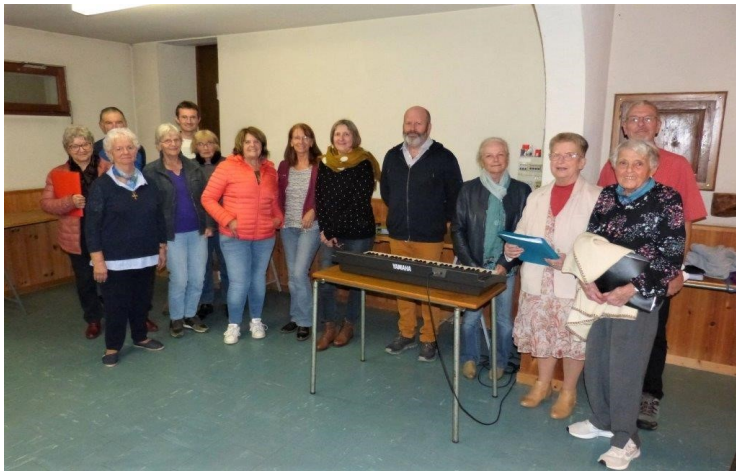
La chorale Vim'Notes au complet

Nous vous demandons de le faire connaître à vos connaissances. Partage du verre de la cordialité à l'issue du concert Entrée libre