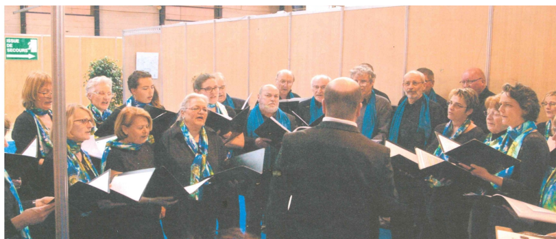
Chorale Music Yenne à la Foire de Savoie