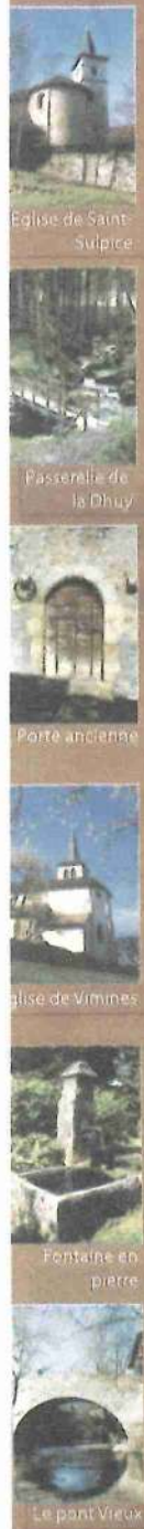
Eglise de Saint-Sulpice